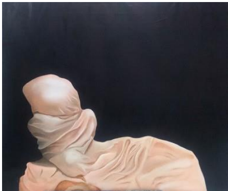
Gambar 4. Feminim

tubuh yang sedang terduduk atau tersandarkan. Dengan bentuk kepala, tangan, dan sebagian kaki terlihat jelas. Kain mengikuti bentuk objek dan menyebar sedikit bertumpuk tetapi draperi yang dihasilkan tidak terlalu banyak.