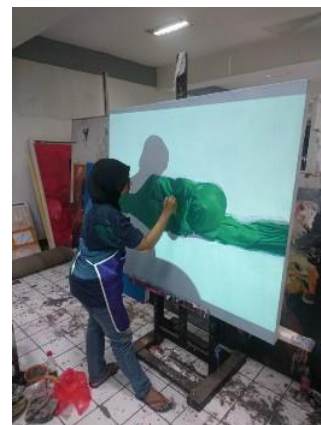
Gambar 3. Proses Melukis