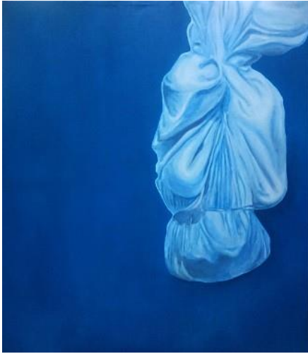
Gambar 5. Transisi

yang menggunakan susunan warna monokrom. Komposisi dalam lukisan ini menempatkan objek utama berada di pojok kanan atas sebagai poros keseimbangan antara bagian kiri dan agar berkesan tidak berat sebelah dan menyesuaikan konsep bidang luas pada background . Dalam pembentukan kontur, bagian objek yang terkena sinar ditumpuk secara bertahap dengan warna yang cerah seperti warna biru muda dan putih sedangkan pada bagian yang terkena bayangan ditumpuk dengan warna biru tua dan abu-abu. Pada tahap terakhir yaitu proses finishing, penekanan bentuk kontras warna gelap dan terang pada objek seperti bagian kepala, tangan dan kaki yang lebih menonjol dipertegas dengan pencahayaan yang lebih terang. Keseimbangan dalam lukisan ini juga dicapai dari pembentukan volume warna dengan penerapan sinar bayangan yang serasi dan harmonis antara objek dan background .