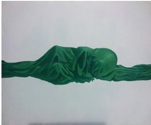
Gambar 6. Rehat

menggunakan warna turunan dari objek utama yaitu light grey blue dan background warna hijau. Dengan sandingan satu warna tua dan muda maka karya ini ada pada karya yang menggunakan susunan warna netral. Komposisi dalam lukisan ini menempatkan objek utama berada di tengah sebagai poros keseimbangan antara bagian atas dan bawah agar berkesan tidak berat sebelah dan menyesuaikan konsep bidang luas pada background. Dalam pembentukan kontur, bagian objek yang terkena sinar ditumpuk secara bertahap dengan warna yang cerah seperti warna hijau muda dan putih sedangkan pada bagian yang terkena bayangan ditumpuk dengan warna hijau tua. Pada tahap terakhir yaitu proses finishing, penekanan bentuk kontras warna gelap dan terang pada objek seperti bagian kepala, tangan, dan kaki yang lebih menonjol dipertegas dengan pencahayaan yang lebih terang.