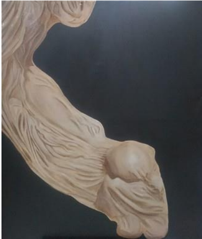
Gambar 7. Jatuh

coklat tua. Dengan sandingan satu warna tua dan muda maka karya ini ada pada karya yang menggunakan susunan warna monokrom. Komposisi dalam lukisan ini menempatkan objek utama berada di pinggiran bagian kiri menuju kanan bawah sebagai poros keseimbangan antara bagian tengah dan kanan atas agar berkesan tidak berat sebelah dan menyesuaikan konsep bidang luas pada background. Dalam pembentukan kontur, bagian objek yang terkena sinar ditumpuk secara bertahap dengan warna yang cerah seperti warna coklat muda dan putih sedangkan pada bagian yang terkena bayangan ditumpuk dengan warna coklat tua. Pada tahap terakhir yaitu proses finishing, penekanan bentuk kontras warna gelap dan terang pada objek seperti bagian kepala, tangan, dan kaki yang lebih menonjol dipertegas dengan pencahayaan yang lebih terang.