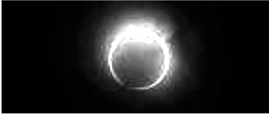
Gambar 3. Peristiwa Gerhana Bulan atau Matahari