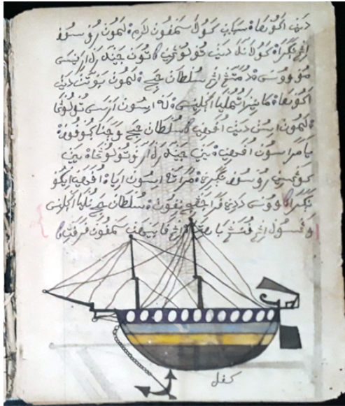
Gambar 5. Halaman 28 SB KBG 183

dan hitam. Bagian bawah obyek terdapat caption beraksara Pegon bertuliskan “kapal”.