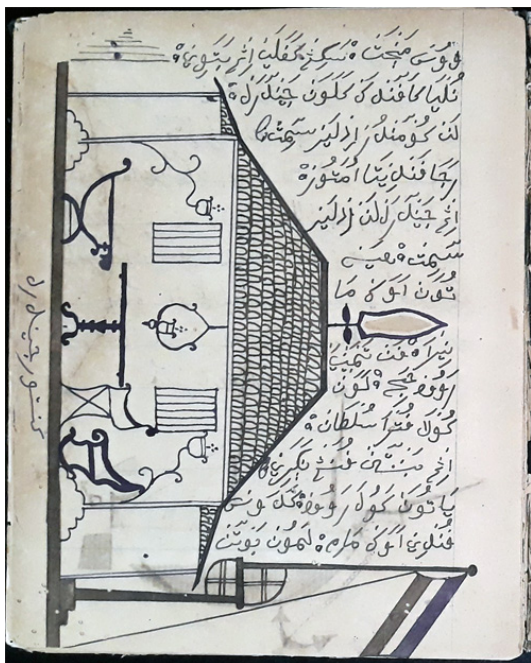
Gambar 4. Halaman 27 SB KBG 183