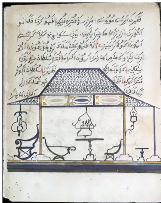
Gambar 3. Halaman 23 SB KBG 183