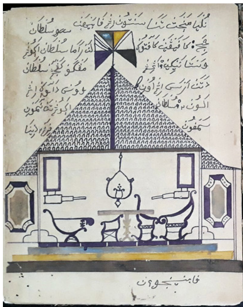
Gambar 6. Halaman 29 SB KBG 183

dengan ornamen berupa tiang yang di atasnya terdapat 3 bendera/objek bentuk segitiga masing-masing dengan 2 warna: segitiga kanan warna putih dan ungu, segitiga kiri warna putih dengan 2 garis dan ungu, segitiga atas warna ungu atau biru yang sudah pudar (kiri) dan kuning (kanan). Bagian dalam bangunan terdapat 4 kursi 1 meja, 1 lampu gantung di tengah, dan 2 objek yang kemungkinan lampu cempor/minyak. Bagian bawah gambar terdapat caption beraksara Pegon bertuliskan "panenjoan" atau tempat melihat.