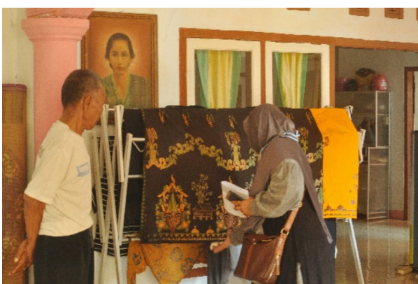
Gambar 7. Batik yang sudah jadi