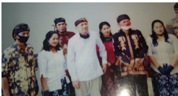
Gambar 5. Kunjungan Menteri Koperasi dan UKM serta Bupati Garut