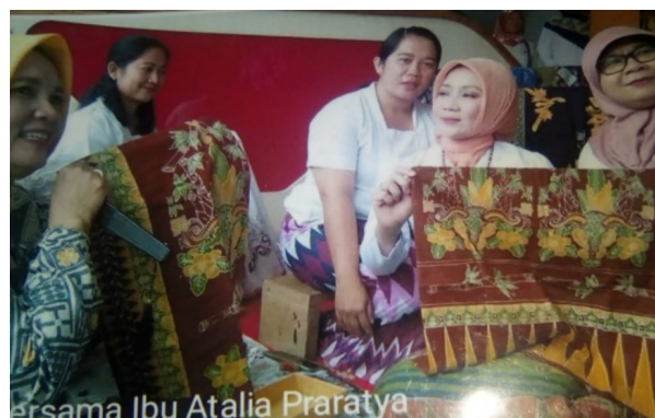
Gambar 4. Kunjungan Atalia Praratya (Istri Gubernur Jawa Barat)