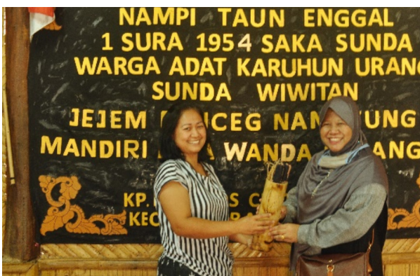
Gambar 8. Batik dikemas di dalam bambu

Pare , artinya lumbung tempat menyimpan padi. Motif-motif itu menunjukkan bahwa di kehidupan masyarakat tidak lepas dari bahan-bahan pokok.