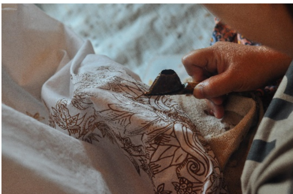
Gambar 6. Proses Pembuatan Batik Pasiran