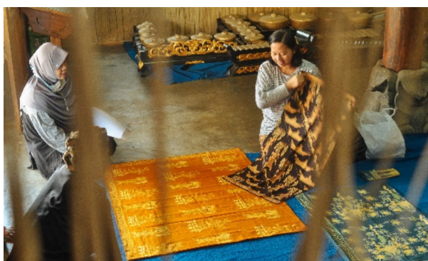
Gambar 3. Bale (Aula Pertemuan)