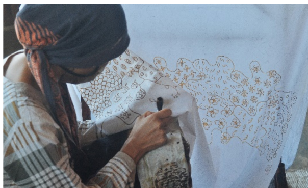
Gambar 2. Pembatik Kampung Pasiran melakukan kegiatan membatik