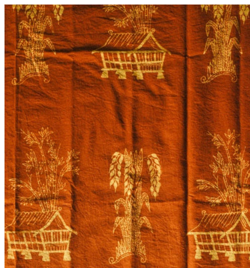
Gambar 10. Motif Leuit Pare

yang dikutip Wihardi (2015) menjelaskan bahwa terdapat tiga cara untuk menjelaskan asal sebuah makna. Pendekatan pertama mengatakan bahwa makna adalah sesuatu yang bersifat intrinsik dari suatu benda. Pendekatan kedua terhadap asal-usul yang melihat makna itu “dibawa kepada atau bagi siapa benda itu bermakna”. Sementara yang ketiga, ia menjelaskan makna adalah produk sosial atau ciptaan yang dibentuk dalam dan melalui pendefinisian aktivitas manusia ketika mereka berinteraksi (Wihardi, 2015, hlm. 108).