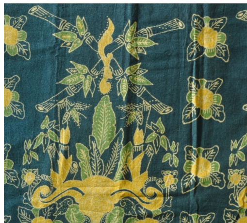
Gambar 9. Motif Mayang Kahuripan (Sumber: Dokumentasi Penulis, 11 Sept 2020)

Kedua motif pada gambar tentunya menyimpan makna tersendiri seperti halnya hasil batik dari daerah lain yang juga sarat makna, sehingga di setiap motif yang dibuat selalu terkandung nilai-nilai filosofis di dalamnya. Menurut Blumer (1969) seperti