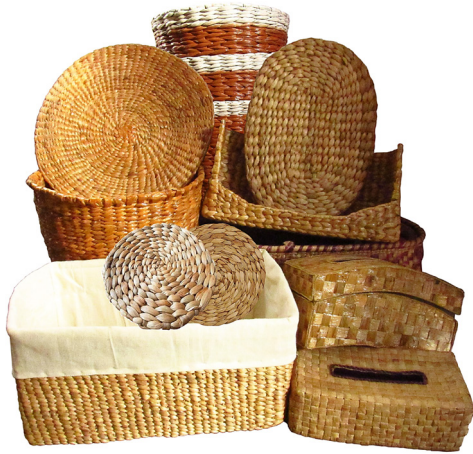
Gambar 3. Jenis produk seni kerajinan eceng Gondok Gorontalo lainnya.

Produk-produk tersebut juga diadaptasi dari produk sejenis yang telah ada, namun tidak ada masalah dengan fungsi dan ukuran sehingga lebih mudah diterima pasar. Hampir semua produk yang dibuat para perajin merupakan hasil adaptasi produk sejenis yang telah ada, dengan memanfaatkan bahan baku eceng gondok sebagai pembeda. Dampaknya, produk kerajinan eceng gondok kalah saing dengan produk dari kulit, rotan, atau kain, yang tampak lebih eksklusif. Guna peningkatan daya saing produk kerajinan eceng gondok, penting dilakukan inovasi produk melalui penciptaan desain-desain baru yang khas sesuai selera pasar. Pengembangan produk seni kerajinan melalui kreasi desain-desain baru yang khas perlu dilakukan agar mampu meraih pasar lebih ekstensif (Sudana, 2014, hlm. 164).