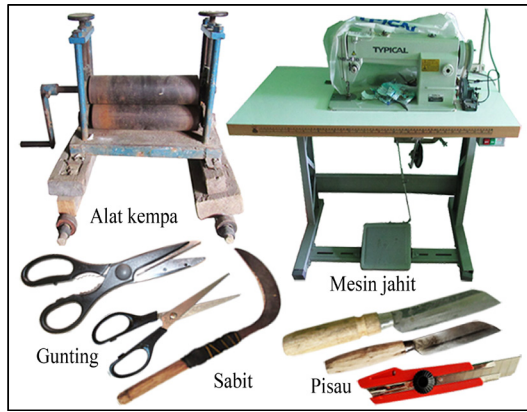
Gambar 1. Peralatan produksi seni kerajinan eceng gondok Gorontalo

jenis: 1) sabit untuk mengambil bahan baku; 2) alat kempa untuk meratakan batang eceng gondok, 3) pisau dan gunting untuk memotong; 3) mesin jahit untuk membentuk dan menempel bahan pendukung (Sudana & Mohamad, 2020: 41). Bentuk peralatan tersebut seperti gambar 1.