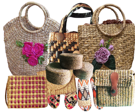
Gambar 2. Produk kerajinan anyaman eceng Gondok Gorontalo jenis melineris

Meskipun tampilan produk yang dihasilkan tampak unik dan berbeda daripada produk yang diadaptasi, namun dari segi ukuran dan nilai ergonomi ternyata kurang berhasil, terutama untuk produk-produk