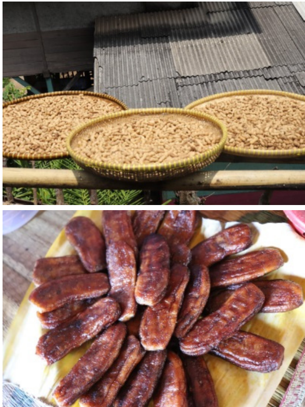
Gambar 7. Olahan oleh-oleh Kampung Dukuh