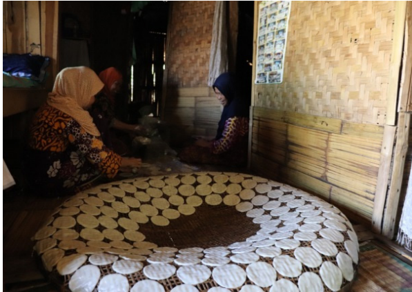
Gambar 9. Proses pengerjaan pembuatan opak

setiap Masyarakat Sunda mempunyai rasa, yang khas, seperti juga Opak Dukuh .