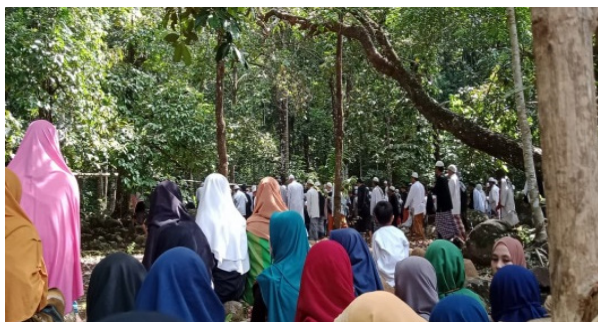
Gambar 3. Kegiatan pengunjung ziarah setelah pengajian jumat malam