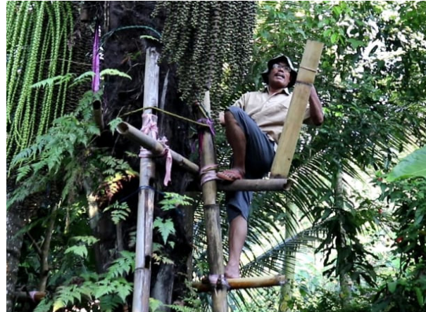
Gambar 6. Proses pengambilan bahan untuk gula aren/merah

Kebun dan sawah yang luas dan subur, tidak hanya ditanami pohon-pohon keras yang memakan waktu bertahun-tahun untuk