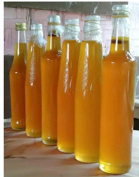
Gambar 8. Madu Dukuh salah satu potensi pendapatan masyarakat

Madu mempunyai khasiat untuk obat secara alami, baik diminum atau disatukan dengan makanan dan minuman.