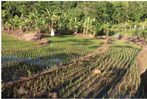
Gambar 5. Pesawahan dan perkebunan Dukuh