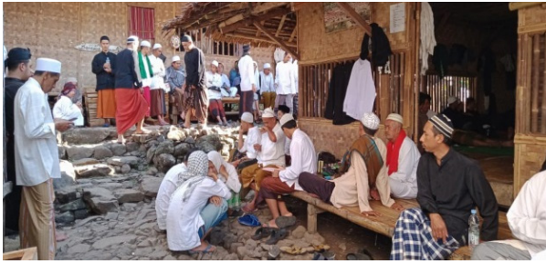
Gambar 2. Tamu dan penduduk pada kegiataan ziarah setiap sabtu