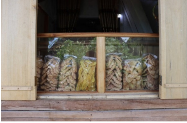
Gambar 4. Warung yang menjual oleh-oleh berlokasi di Dukuh Luar