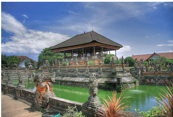
Gambar 1. Kriya pada Bale Kambang, Puri Kertagosa Kelungkung.

kemegahannya. Tradisi seni yang bercorak Hindu klasik mencapai bentuk puncaknya di abad ke-16.