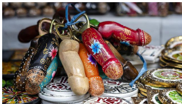
Gambar 10. Kriya kitsch yang dijual di Bali

Kriya kitsch adalah seni yang semata untuk menghibur diri sambil mencocokkan nilai yang dibungkus oleh nostalgia, rasa rindu pada suasana. In his essay, 'Notes on Traditional Kitsch,' Aleksa Celebonovic ticks off a healthy number of examples: traditionally, kitsch is understood to refer to such things as "souvenirs, animals, sickly statuettes, non-functional tumblers and dinner services ... [p]lastic knick knacks, plaster Buddhas, bare-breasted enameled negresses, celluloid trays with lace engravings ... [and] huge cushions of fake velvet." (Emmer, 1998, hlm. 55). Kitsch muncul dari peseni dan penjual pada tahun 1860an, yang merupakan penjual barang artistik yang murah. Istilah ini berasal dari Bahasa Jerman kitschen berarti mempermurah