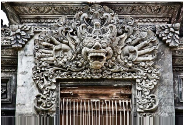
Gambar 3. Kriya karang bhoma

Abad ini pula mulai diperkenalkan hasil olahan flora dan fauna sebagai hiasan bangunan. Muncul berbagai bentuk kekarangan (gubahan), seperti karang gajah dari stilisasi binatang gajah, karang daun bersumber dari stilisasi berbagai daun, karang goak merupakan stilisasi dari burung gagak, karang kakul merupakan stilisasi dari keong sawah, demikian juga yang lainnya.