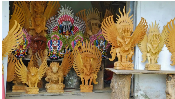
Gambar 7. Kerajinan Garuda di Desa Pakudui Tegal- lalang, Utara Ubud

Tahun 1930-an mulai dibukanya Bali sebagai kunjungan wisata, maka pekerja seni termasuk juga dalam pembuatan kriya mulai berkembang. Hadirnya seni pseudo-tradisional ( pseudo-traditional art ), yaitu kriya yang masih tetap mengacu kepada bentuk serta kaidah-kaidah tradisional, tetapi nilai-nilai tradisionalnya yang sakral, metaksu , dan simbolis telah dikesampingkan atau dibuat semu saja. Sebagai contoh, topeng barong , rangda , patina dewa-dewa dibuat