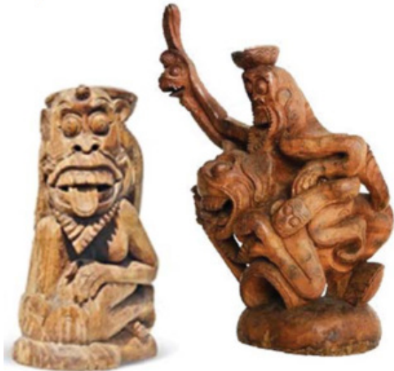
Gambar 6. Karya aliran Tjokotisme

ini bergerak di dalam usaha memelihara dan mempertahankan gaya Ubud yang baru tercipta (Holt, 2000, hlm. 255). Walaupun Yayasan Pita Maha perhatiannya lebih kepada pengembangan seni lukis, namun semangat kriyawan dalam penciptaan karya tidak surut. Hal ini dibuktikan dengan munculnya I Tjokot yang berhasil menunjukkan jati dirinya dengan olahan motif primitif, bahkan memunculkan aliran baru dalam kriya, yaitu Tjokotisme .