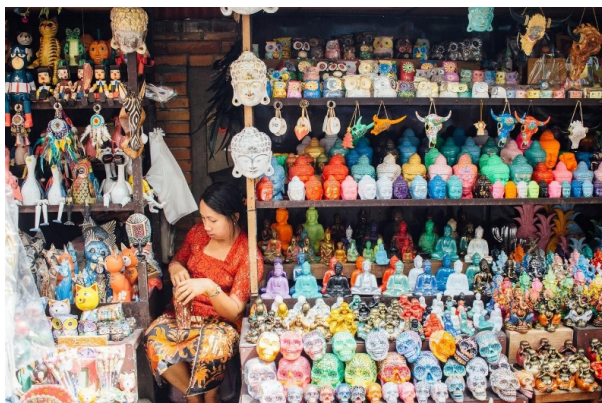
Gambar 9. Penjual kriya kitsch di Pasar Ubud, Bali

sedangkan harga murah melalui kecepatan proses pembuatan, disamping memakai bahan baku yang dimanipulasi. Kitsch cenderung kasar, asal jadi, dan tidak mempertimbangkan kualitas. Seni untuk memenuhi konsumsi massa, bersifat bungkus dan komersial. Seni instan, pembeli bisa merasakan kesenangan langsung saat membeli atau membayar tanpa memiliki pengetahuan yang khusus atau paham tentang arti benda tersebut (Morreall & Loy, 1989, hlm. 67).