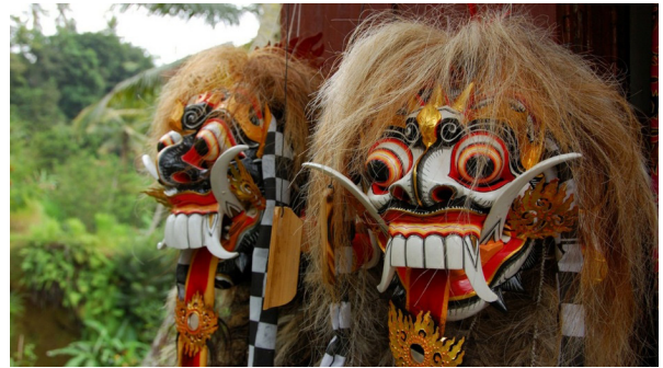
Gambar 8. Kerajinan topeng kayu Rangda, foto oleh Rollan Budi (Sumber: Putri, 2017)

J. Marquet (Soedarsono, 2002, hlm. 271) menegaskan konsepnya bahwa seni wisata sebagai art by metamorphosis , seni yang telah mengalami metamorfose sangat berbeda dengan seni yang dicipta untuk kepentingan masyarakat sendiri yang disebut sebagai art by destination . Art by metamorphosis hampir sama dengan seni pseudo-tradisional yakni seni balih-balihan yaitu kerajinan untuk wisatawan yang berkunjung ke Bali. Pemerintah Bali menyiapkan seni ini guna menyambut kunjungan wisata. Kehadiran seni seperti ini guna menjaga agar genre-genre wali dan bebali tidak dieksploitasi untuk kepentingan komersial. Disebutkan juga oleh Kayam (Kayam, 1981, hlm. 140) dalam menyambut wisatawan, Bali harus menghadirkan “seni dalam rangka”. Kehadirannya di Bali adalah sebuah keniscayaan dalam pasar wisata, meskipun seni ini berada di sela-sela kehidupan masyarakat yang lekat dengan