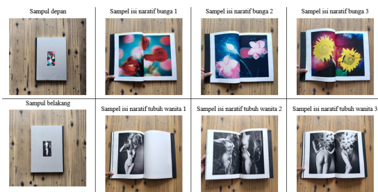
Gambar 2. Sampel Penelitian Buku fotografi "Flores Vitae"

rancangan buku fotografi tersebut untuk menyajikan diptych atau penyandingan suatu narasi atau objek yang dirasa saling terkait. Pemilihan ide tampilan atau konsep tersebut akan membantu pembaca untuk mencari relasi antara narasi yang satu dengan yang lain, sehingga muncul pemaknaan yang lebih dalam terhadap suatu fenomena. Alasan dari ide tampilan tersebut dapat dianalisis dari tulisan teks deskripsi buku tersebut. Dalam teks deskripsi tersebut dinyatakan bahwa buku ini memuat semangat metafora yang indah dari fotografer Nico Dharmajungen. Semangat metafora tersebut terwujud dalam jukstaposisi kecantikan flora dan bentuk wanita telanjang yang ditampilkan dalam perwujudan karya buku fotografi. Menurut kamus linguistik (Kridalaksana, 2008), yang dimaksud metafora adalah pemakaian kata atau ungkapan lain untuk objek atau konsep lain berdasarkan kisa dan atau persamaan. Metafora adalah pengalihan makna atas dasar kesamaan bentuk, fungsi, dan kegunaan. Pengalihan makna tersebut merupakan wujud dari perbandingan dua hal secara implisit.