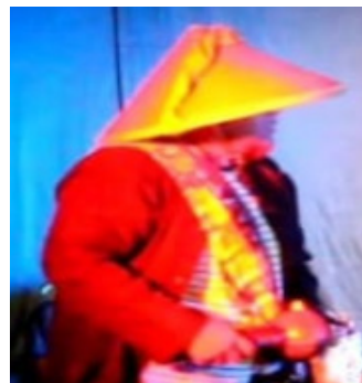
Gambar 9. Ketug