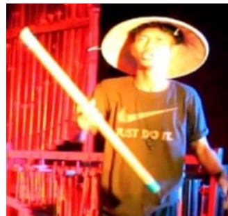
Gambar 8. Seker