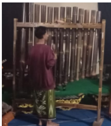
Gambar 4. Bas Gantung