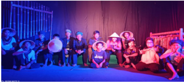
Gambar 14. Pendukung