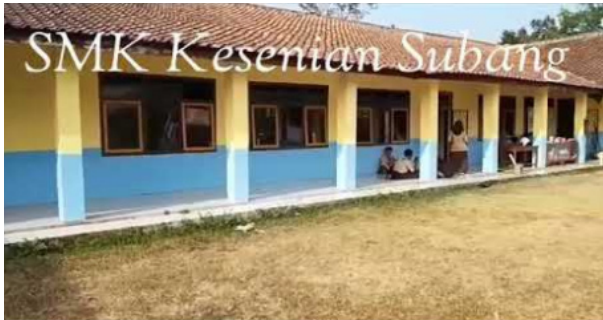
Gambar 15. Lokasi SMK Kesenian Subang