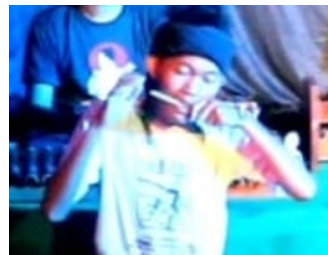
Gambar 7. Karinding