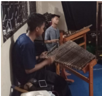
Gambar 2. Gambang