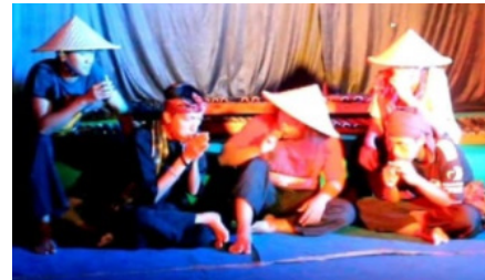
Gambar 6. Empet-empetan