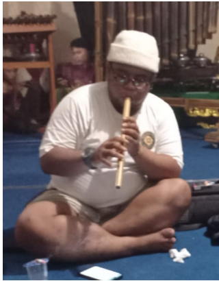
Gambar 1. Toleat