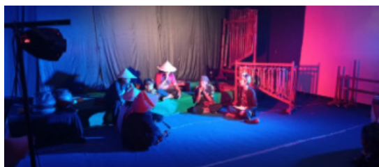
Gambar 11. Penataan Pentas

empetan), Deara (toleat dan empet-empetan), Rizky (Angklung toel), Gian (karinding dan empet-empetan), Ahmad (karinding), Deden (karinding), Sihab (Bas Gantung)