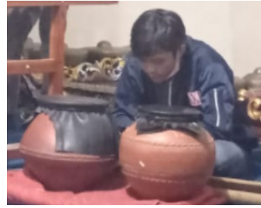
Gambar 5. Buyung