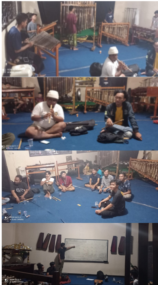
Gambar 10. Proses Berkarya