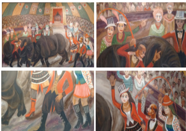
Gambar 2. Sirkus September