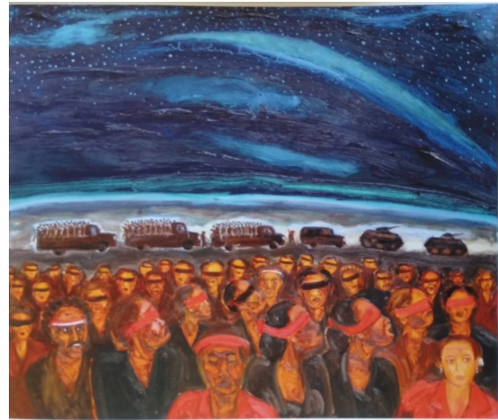
Gambar 1. Lintang Kemukus

Lukisan Lintang Kemukus berukuran 115x140 cm menggunakan cat minyak pada kanvas. Bidang gambar terbagi dalam 4 (empat) ruang. Ruang pertama: separuh bidang bagian atas, melukiskan langit biru, penuh taburan bintang dalam warna putih. Kemudian terdapat warna terang putih kebiruan, melengkung dari tengah ke kanan bidang gambar. Pada bagian ujung tengah cahaya itu, Djokopekik menorehkan tulisan tipis, "awal bencana lintang kemukus 1965". Ruang kedua: pada bidang tipis tengah dilukiskan cakrawala berhimpitan antara warna biru gelap, dengan