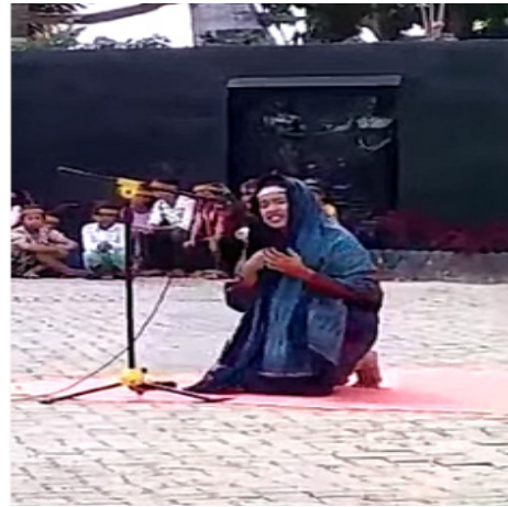
Gambar 2 Penampil andung di ajang kompetisi andung

Salah satu faktor dari semakin berkurangnya penampilan andung dalam upacara kematian masyarakat Batak Toba disebabkan pengaruh ajaran agama Kristen yang berkembang di tanah Batak. Masyarakat diminta untuk tidak lagi meratapi keluarga mereka yang meninggal. Mereka disarankan untuk berdoa kepada Tuhan dan menyampaikan keluh kesah mereka dengan nyanyian yang terdapat pada Buku Ende (Buku kumpulan lagu-lagu rohani Kristen berbahasa Batak) yang digunakan umat Kristen dalam acara peribadatan di Gereja Hodges (2006, hlm 287; 2009, hlm 52). Pergeseran fungsi andung dari ratapan sakral yang ditujukan kepada MJB kepada lagu-lagu rohani yang ditujukan kepada Tuhan lambat laun membuat makna syair andung juga menjadi mengalami pergeseran (Sihombing, 2019, hlm 173). Oleh karena itu,