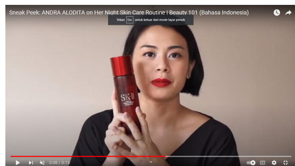
Gambar 2. Screen capture adegan review Lipstik Wardah .

Dalam tahapan representamen (R1), analisis yang dilakukan merupakan analisis deskriptif elemen formal dari adegan screen capture di atas. Elemen visual yang terdapat pada gambar di atas dapat dikelompokkan menjadi kelompok dalam warna dengan unsur kedekatan dan kemiripan warnanya (Palmer, 1975) Pengelompokan tersebut terbagi menjadi tiga kategori warna yang kebetulan dalam adegan ini menggunakan warna satu tone dengan warna turunan yang cukup mirip, tetapi dapat dibagi menjadi