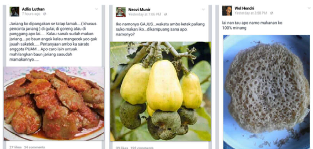
Gambar 2. Foto Unggahan dengan Topik Kuliner

Gambar 2 di bawah ini merupakan contoh foto-foto unggahan dengan topik kuliner yang terdapat pada dinding komunitas virtual tersebut. Foto-foto tersebut membuka percakapan dalam palanta , melalui topik kuliner yang ringan dan membangkitkan kenangan dan relasi individu dengan kampung halamannya. Topik kuliner memang kerap mendapat perhatian dari anggota komunitas lain. Mulai dari Like yang diberikan oleh anggota komunitas lain sampai dengan interaksi yang terjadi dalam komentar-komentar yang diungkapkan.