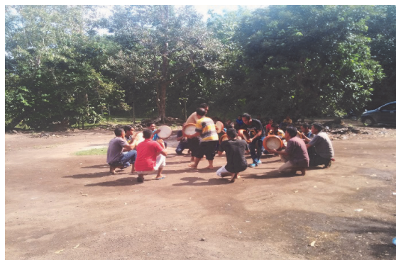
Gambar 1. Latihan formasi gerak melingkar pada sore hari

Eksistensi pertunjukan musik Kompang di Bantan Tua berkontribusi pada keberlangsungan dan stabilitas budaya masyarakatnya. Fungsi seni dalam kesenian ini memiliki beberapa fungsi. Pertama, sebagai hiburan pribadi, yakni untuk kepuasan pribadi, baik sebagai pemain, pengelola, maupun sebagai anggota masyarakat pendukung budaya (seni Kompang). Kedua, sebagai hiburan kelompok dalam membawakan repertoar yang dimainkan dengan sederhana dan keterbatasan, baik alat, pengetahuan manajemen, dana oprasional, dan lain lain. Di Bantan Tua, hal menarik pada kelompok Delima bahwa seluruh anggota kelompok memiliki hubungan keluarga (mertua, kakak beradik, beripar, atau keponakan). Ketiga, sebagai hiburan masyarakat, yakni dalam bentuk pertun-