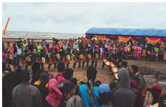
Gambar 3. Pertunjukan Kompang Grup Delima pada Pesta Pantai

Penyelenggaraan pertunjukan kesenian Kompang bukan hanya oleh pemerintah, swasta, masyarakat (individu). Penyelenggaraan yang bersifat individu dikategorikan sebagai bantuan dalam bentuk kepedulian